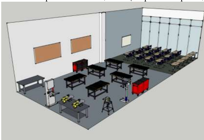
Схема зонирования помещения Центра в 3D-проекции