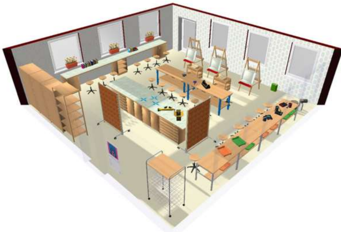
Схема зонирования помещения Центра 3D-проекции