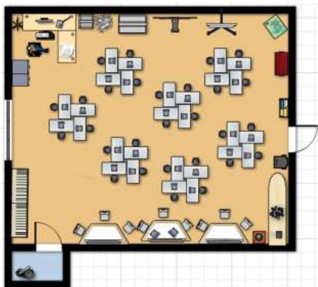
Схема зонирования помещения Центра в 3D-проекции