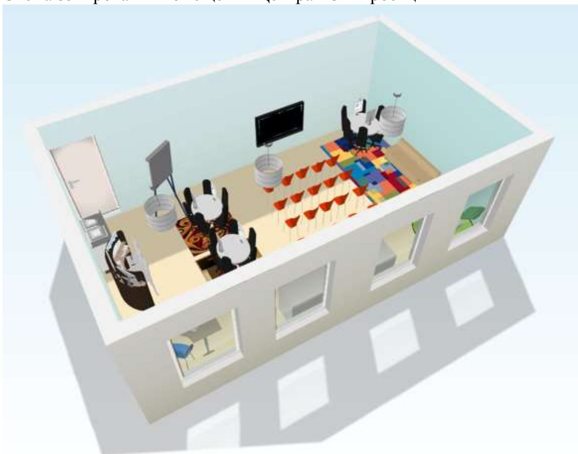
Схема зонирования помещения Центра в 3D-проекции